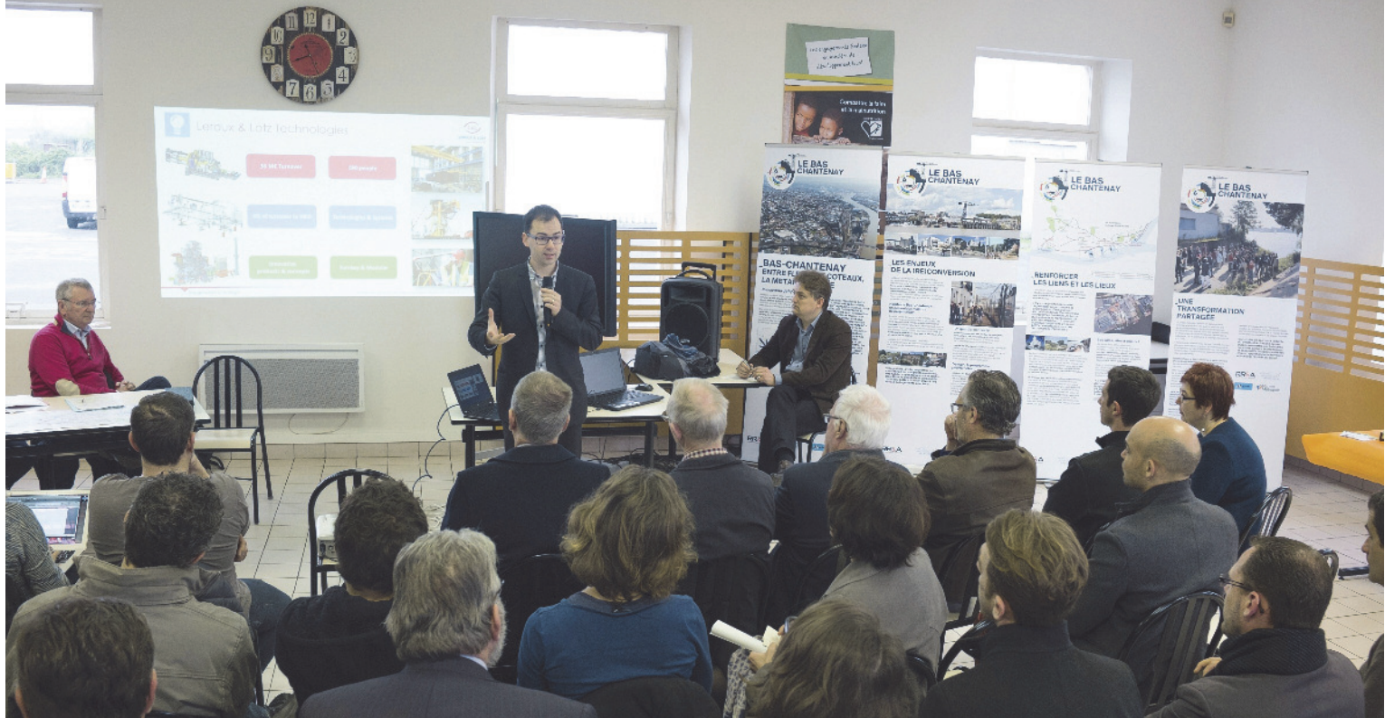
Réunion des acteurs économiques

Cette réunion du 30 mars a été l'occasion de mettre l'accent sur les grands axes retenus par la métropole pour s'engager dans cette nouvelle aventure urbaine. Développement de l'emploi, création de nouveaux logements, renforcement des lignes de transport et réalisation d'espaces verts et publics... seront au cœur de la métamorphose de cette rive de la Loire.