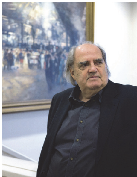
Bernard Reichen

Dès 2013, le dialogue avec les habitants s'engageait : un atelier citoyen réunissant 26 habitants et l'équipe d'animation a permis de révéler un « diagnostic sensible du paysage » pour le quartier du Bas-Chantenay.