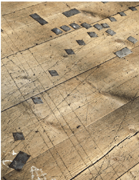
Détail du plancher de la salle à tracer