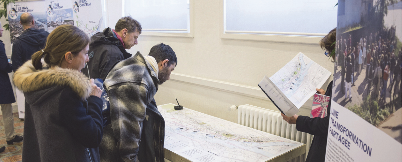
Exposition publique Mairie de Chantenay