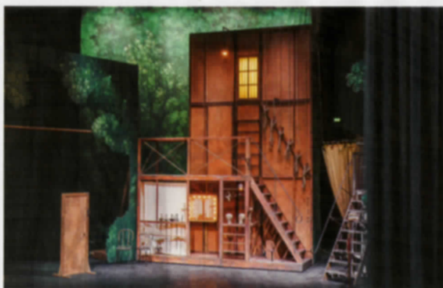
Détail des décors signés Éric Ruf pour Cyrano de Bergerac .