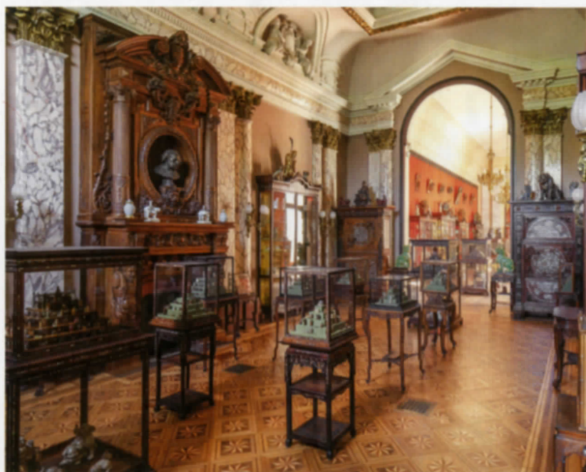
Inscrit aux monuments historiques, ce musée secret nous plonge au cœur du XIX e siècle. Des milliers de pièces exceptionnelles y sont présentées dans les vitrines d'origine.

Reconstruit dans les années 1960, après avoir été détruit en mai 1940, le musée des Beaux-Arts de Calais poursuit son redéploiement. Le 13 mai, de nouvelles galeries permanentes ouvrent au rez-de-chaussée du bâtiment, en lieu et place de la salle d'exposition temporaire. Une nouvelle présentation en 250 œuvres, du XVI e siècle à nos jours, permet de mieux appréhender l'évolution des goûts artistiques à travers une dizaine de thématiques (le musée disparu, le salon bourgeois, etc.), selon un parcours fluide et stimulant. L'occasion de mettre en avant deux nouvelles donations d'artistes locaux : celles du sculpteur Henri Delcambre (1911-2003) et de la peintre Jeanne Thil (1887-1968). mba.calais.fr